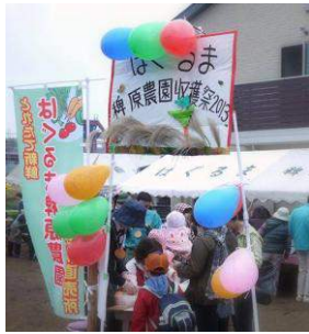
昨年の収穫祭の様子

今年は、子供たち向けのイベントが盛りだくさんです。仲間と子どもたちの笑顔があふれる素敵な収穫祭を目指します！(収穫祭実行委員会より)